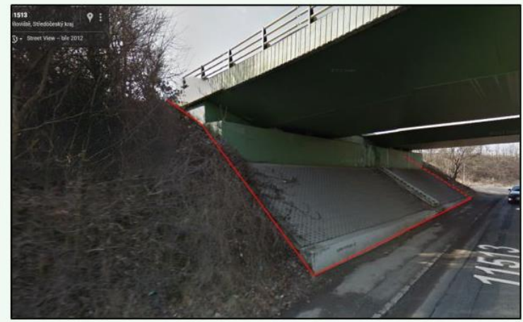
Schéma řešení průběhu majetkové hranice